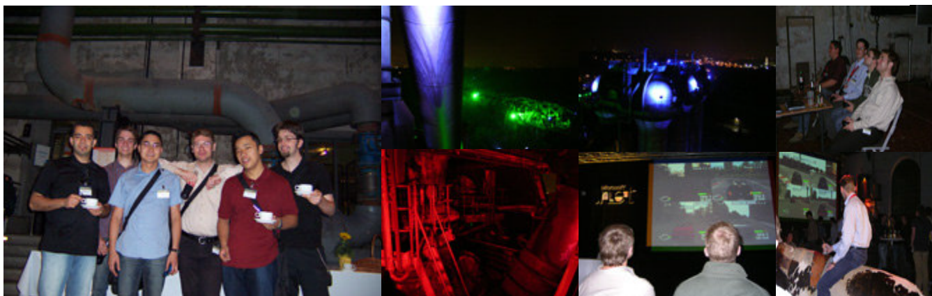
„5 Winfos und 1 DMIler aus 2bridges“